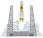
ものすごく はやい!!