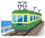
まあまあの はやさ!